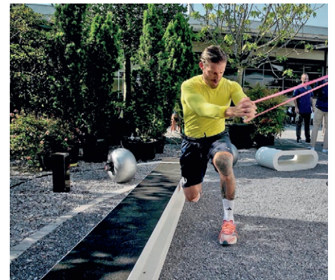
Outdoor-Fitnessgeräte vereinen körperliches Training und Naturerlebnis.

zeit, sondern um komplexe Geräte, die definierte Sicherheitsstandards erfüllen und witterungsbeständig sein müssen.